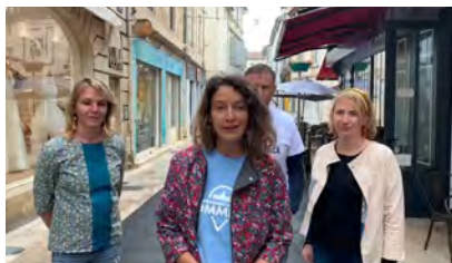
Vidéo pour le vote du public d'un projet de vêtements pour femme - Langon