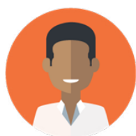
Service (hors médical)