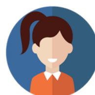
Associations et collectifs citoyens

Tous les projets allant dans le sens d'une revitalisation du centre-bourg sont aussi les bienvenus : du commerce « traditionnel » au tiers lieu (fablab, espace de coworking) en passant par tout autre service inédit à destination des commerçants – habitants en centre-ville.