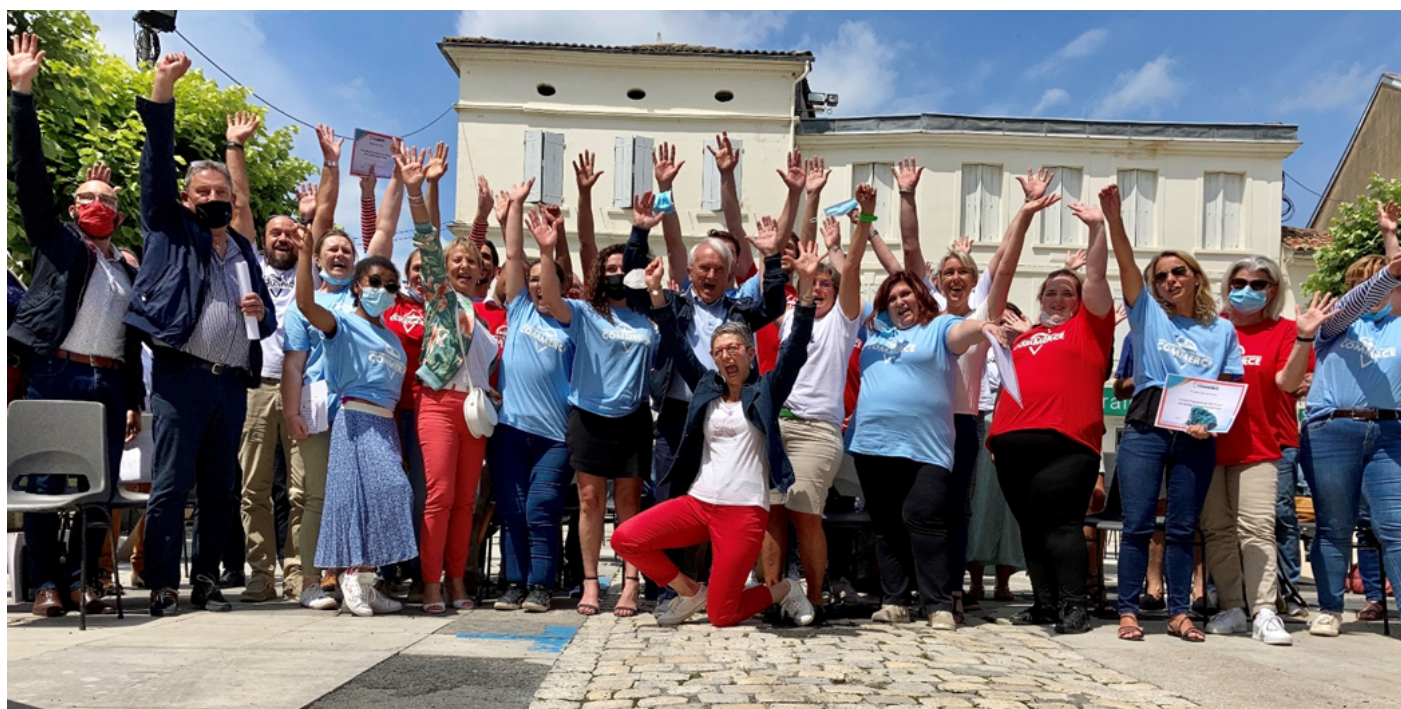
Finale du MCBAIC à Barbezieux Saint-Hilaire en Juin 2021

La date n'est pas encore fixée, mais devrait s'établir au dernier trimestre 2022.