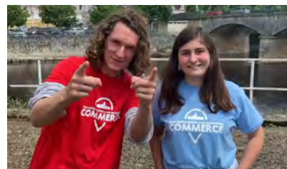
Vidéo pour le vote du public d'un projet d'une guinguette - Montmorillon