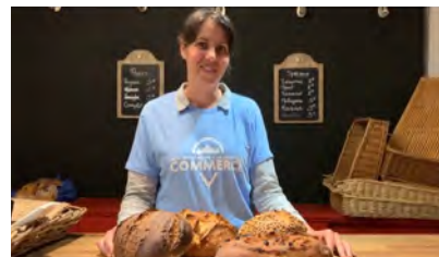
Vidéo pour le vote du public d'un projet de fournil bio - Cancon