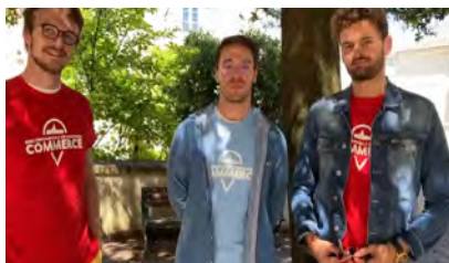
Vidéo pour le vote du public du projet Yapuka - Barbezieux-Saint-Hilaire

Vous pouvez cliquer sur les photos pour avoir accès au contenu vidéo :