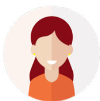
Commerçants et artisans

Toutes les activités en cours de création et ayant besoin d'un local, d'un emplacement, ainsi que les